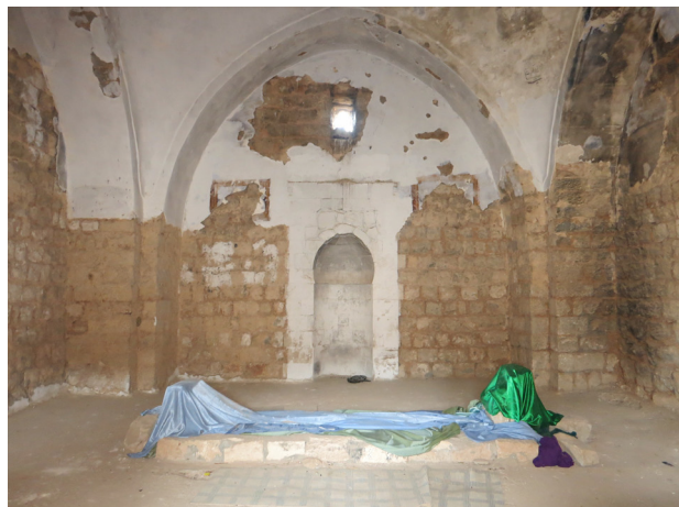
איורים 8, 9. א־נבי יושע. שרידי הכפר השיעי שנבנה סביב מקאם (ציון קבר) קדוש ונעזב ב־1948. העלייה לרגל לקבר ממשיכה להתקיים גם כיום. צילומים: אשרת וולפלינג-אסא, 2015